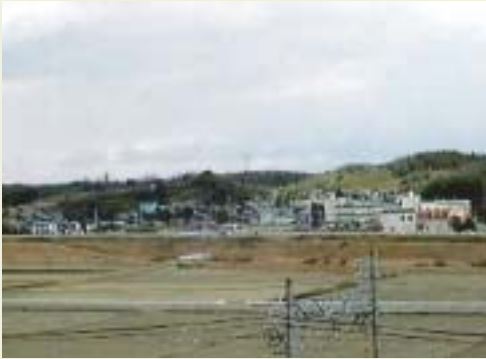
真ん中の山が城址

新海氏の出自はともかく、室町期の宮津に新海なる豪族があり、坂部の久松氏と阿久比谷を二分する勢いがあった。室町幕府の権威がしっかりとしている間は、守護家の被官